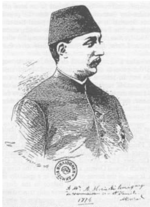
Prince Murat

Le nouveau sultan ne tarda pas à revenir sur sa promesse envoyant le Frère Grand Vizir Midhat Pacha en exil au Yémen, alors une province de l'Empire ottoman et, redoutant un sursaut des maçons, organisera sa mort par empoisonnement. Le 13 Février 1878 le Sultan Abdul-Hamid II ajourna indéfiniment le parlement, en commençant une période de despotisme qui a durera 30 ans. Sous son règne, l'activité maçonnique était tenue sous le strict contrôle du sultan.